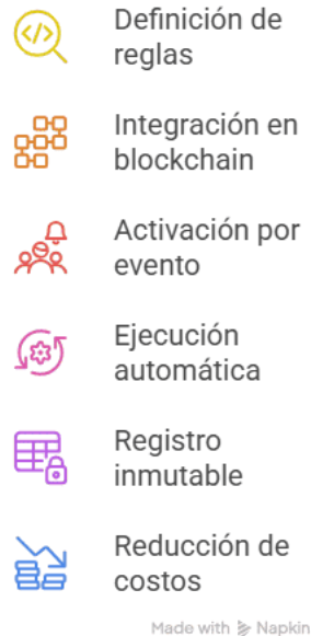
Figura 2. Automatización y eficiencia operativa

Para sintetizar el proceso descrito, el siguiente esquema organiza de manera secuencial cómo la automatización contractual se integra en la infraestructura blockchain y genera eficiencia operativa. La enumeración permite visualizar el recorrido completo desde la definición de reglas hasta la reducción de intermediación y costos dentro de la organización.