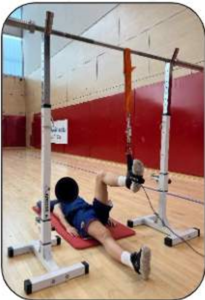
Posición de valoración