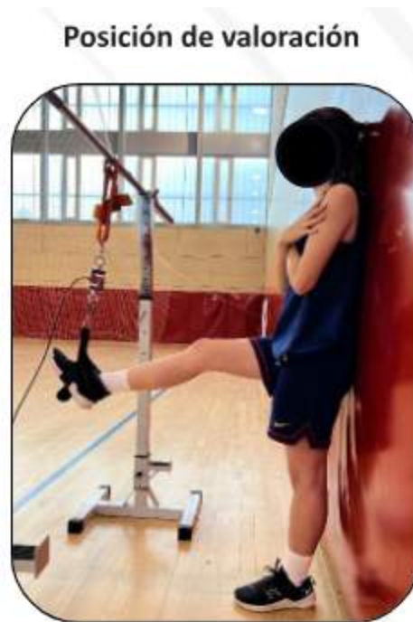
Figura 4: Posición de valoración