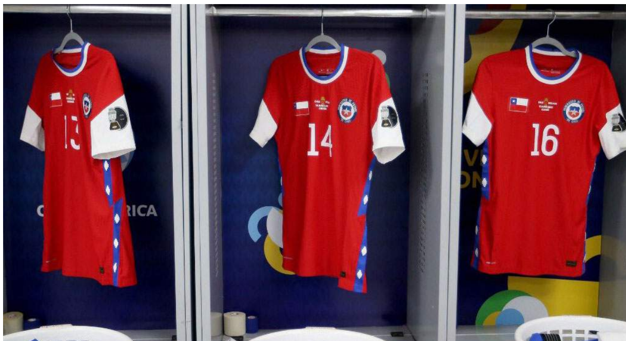
Figura 2: Durante varios partidos del 2021 la selección de Chile tapó el logo de Nike con la bandera del país por un conflicto contractual