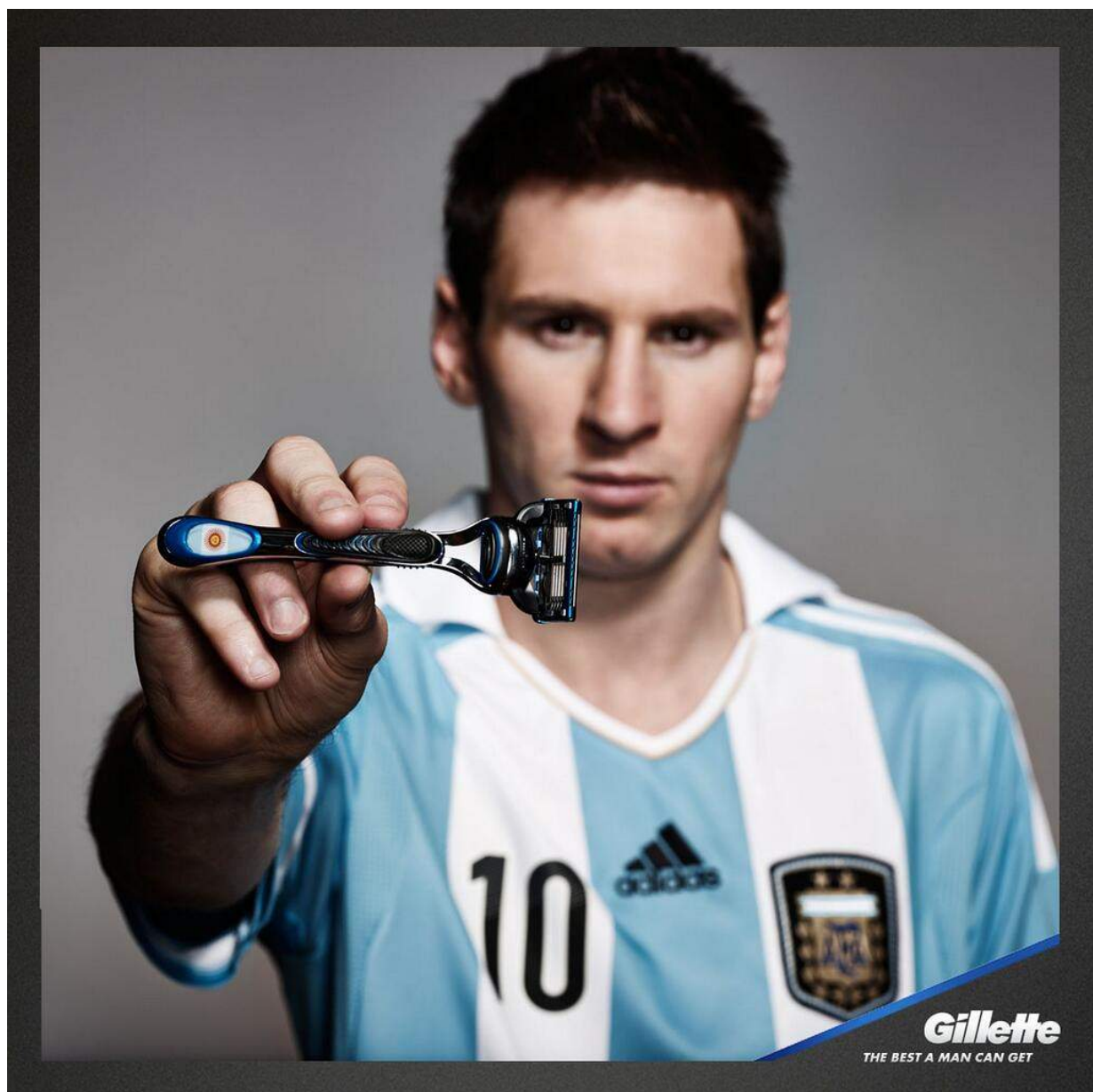
Figura 3: Messi promocionando una edición especial de Gillette con la bandera de la selección argentina

contrapropuesta de dinero, sino de valor agregado que se les ha dado a las marcas. Se puede afirmar que uno de los valores más grandes que tiene el patrocinio deportivo es este.