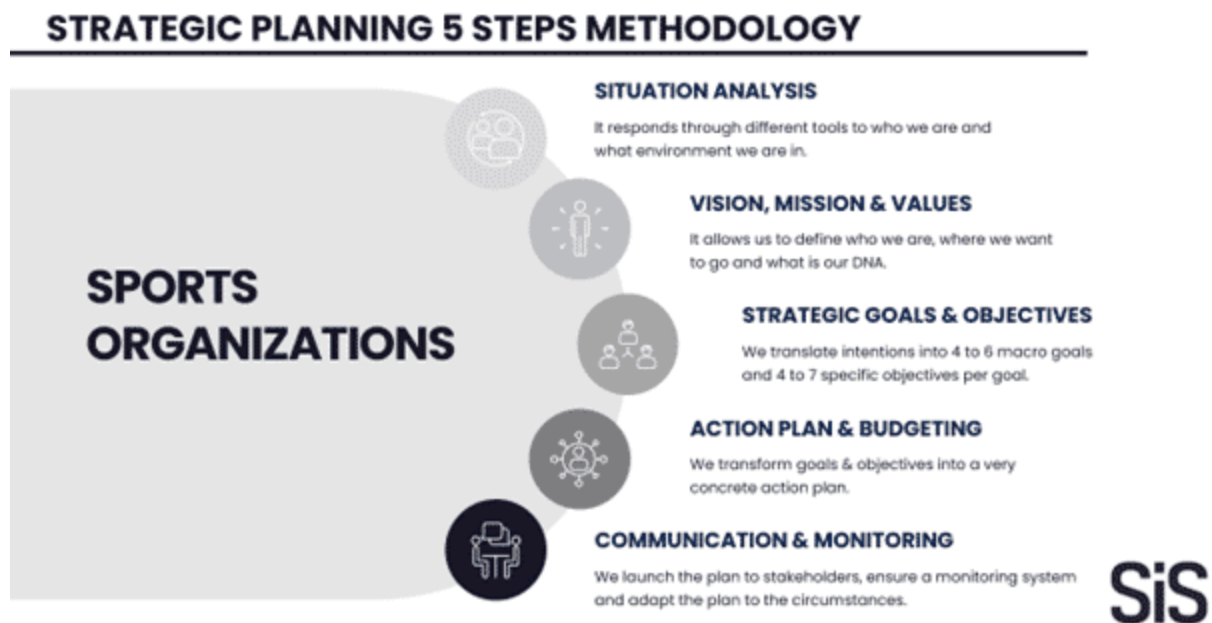
Figura 2: Proceso de planificación estratégica