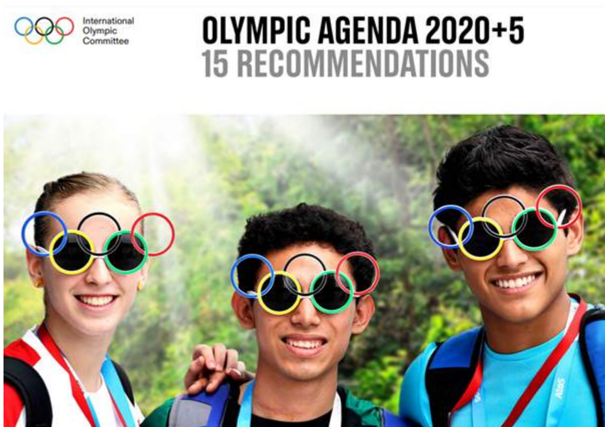
Figura 3: Comité Olímpico Internacional

emergentes y aprovechar oportunidades que se alineen con las necesidades cambiantes de los deportistas, los fans y la sociedad. Al integrar estas áreas clave en su planificación estratégica, las organizaciones deportivas pueden posicionarse como líderes en la promoción del cambio positivo, fomentar la inclusión y dejar legados duraderos. (Comité Olímpico Internacional, 2020). La Agenda Olímpica 2020+5 busca asegurar el éxito y la relevancia a largo plazo de los Juegos Olímpicos y del Movimiento Olímpico, y al mismo tiempo promueve un cambio social positivo y un impacto en todo el mundo.