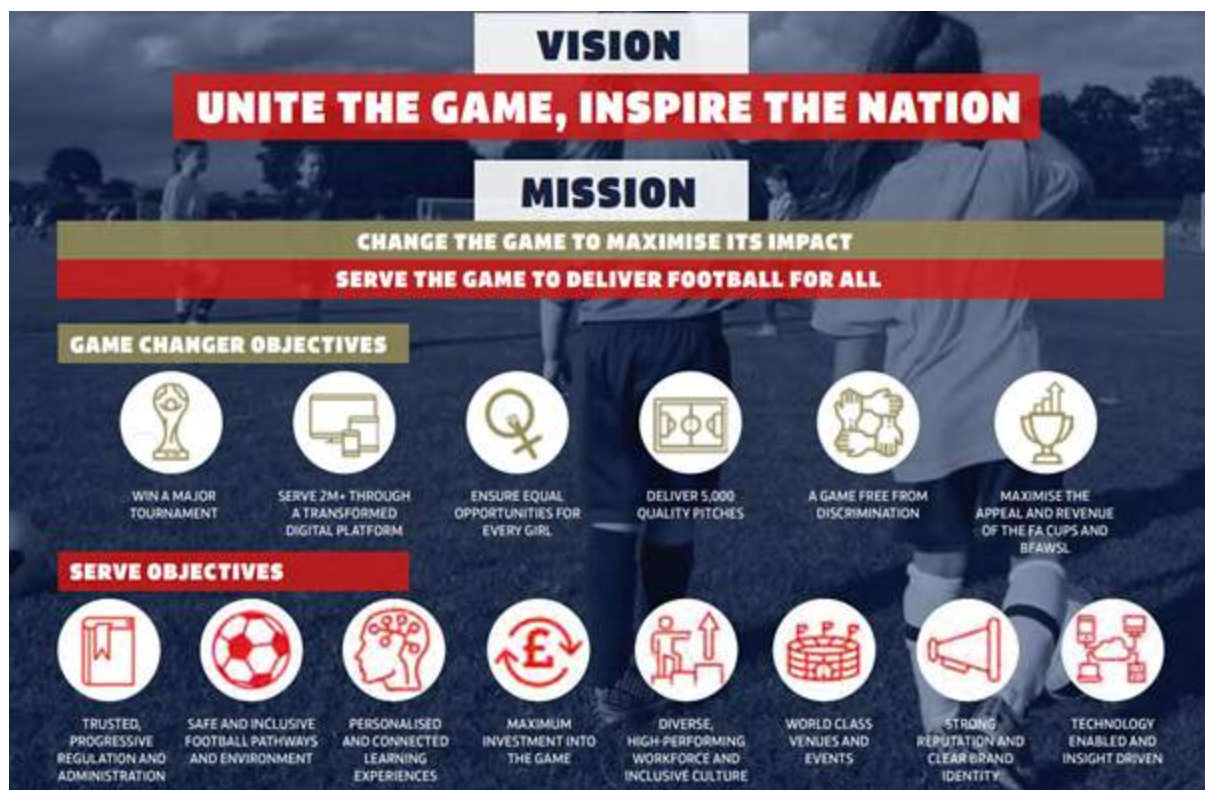
Figura 5: Visión

Fuente: The Football Association, 2020, p. 12.