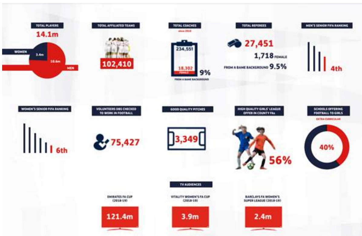
Figura 4: Estadísticas del juego