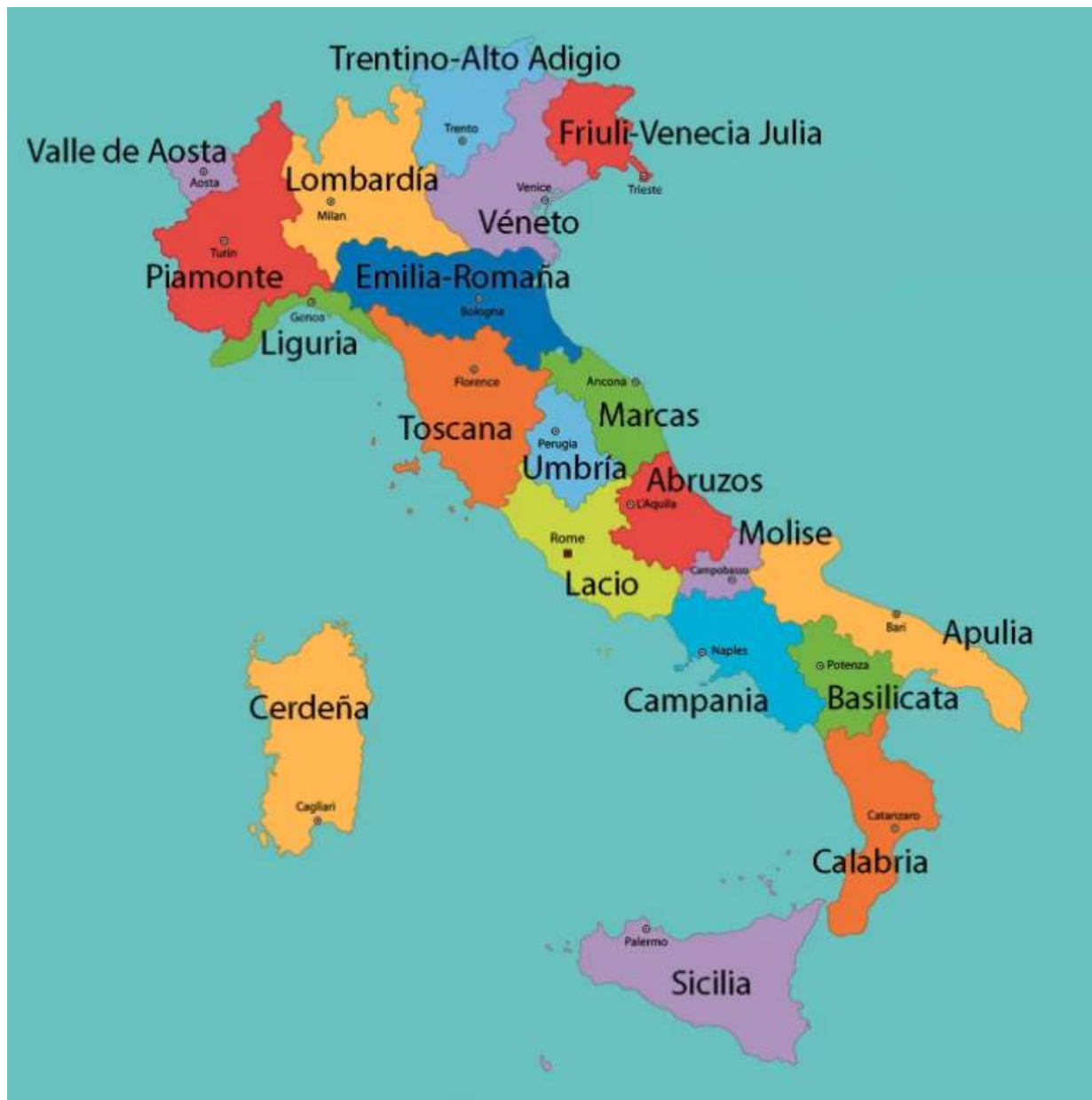
Figura 12. Mapa de Italia