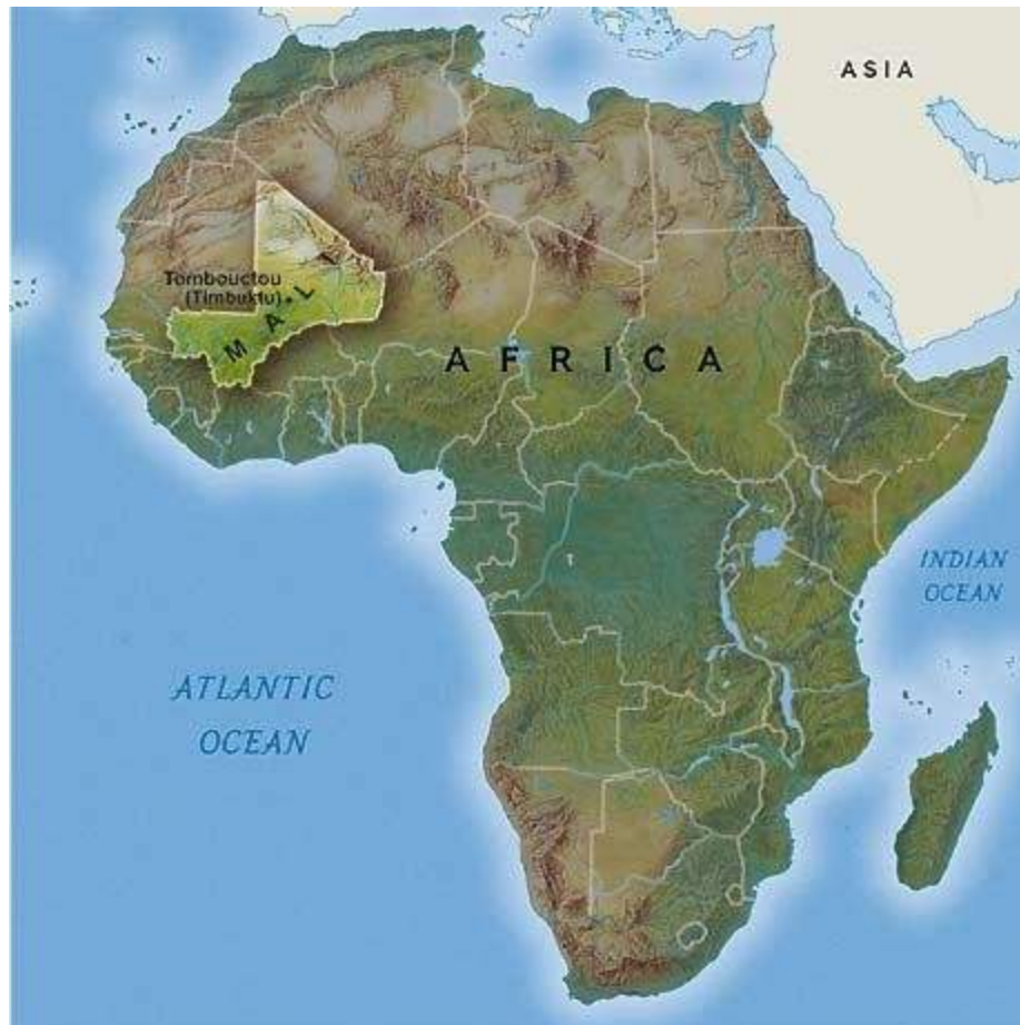
Figura 3. Mapa de Mali