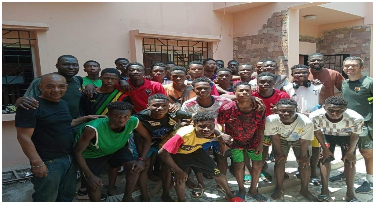
Figura 8. F tbol africano

FCB tiene un acuerdo con la Academia Ivoire, que es la m s grande de  frica, con una superficie de 40 hect reas.