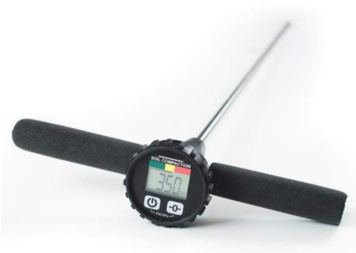
Figura 4: Penetrometro