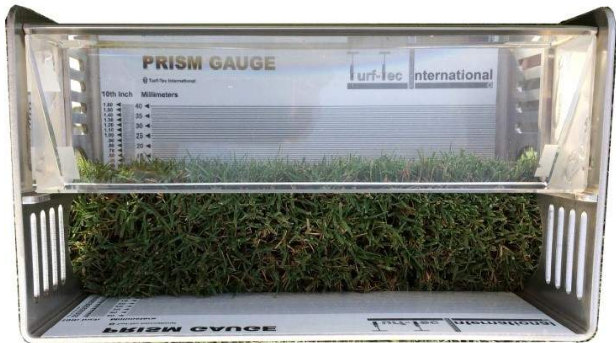
Figura 7: Prisma