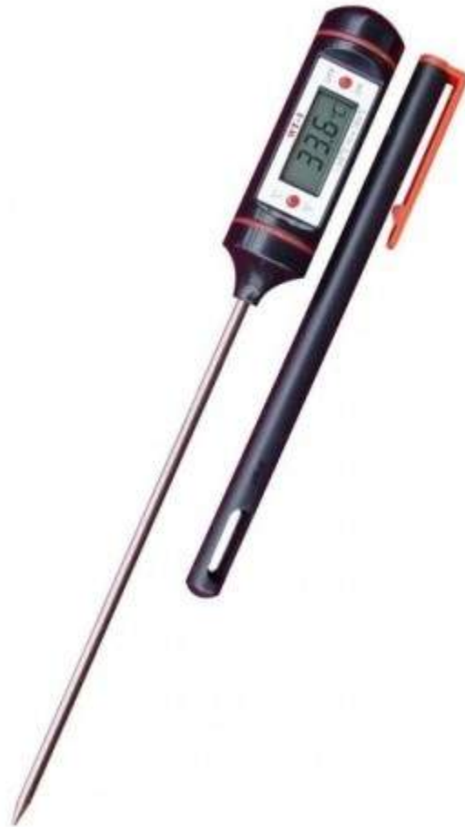
Figura 11: Termômetro digital