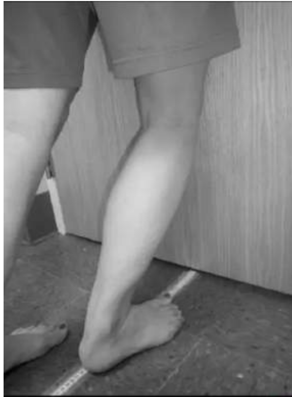
Figura 5. Lunge test