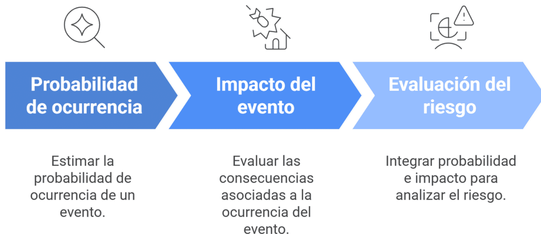
Figura 2. Componentes del riesgo desde la probabilidad aplicada

presentar un valor esperado favorable, pero al mismo tiempo una dispersión elevada que incremente la probabilidad de resultados desfavorables. La evaluación de riesgo permite integrar ambas dimensiones en la toma de decisiones, evitando interpretaciones simplificadas basadas únicamente en promedios.