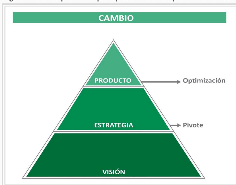
Figura 1: Gráfico piramidal que representa a un emprendimiento nuevo

Teniendo en cuenta esta definición, Ries (2013) plantea que un nuevo emprendimiento se divide en tres partes, conformando una pirámide, como se observa en la siguiente imagen.