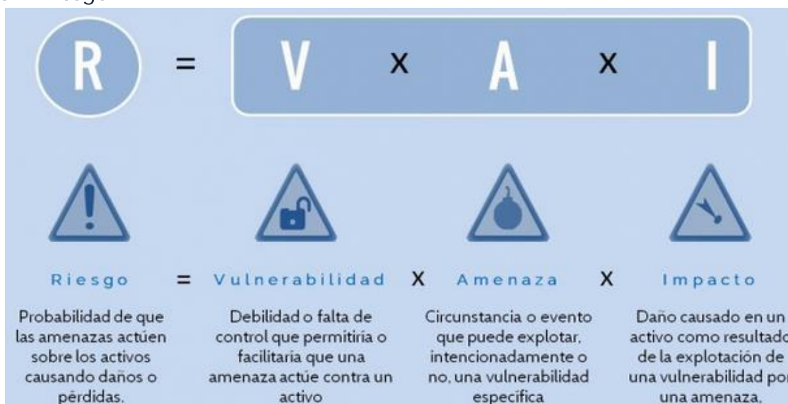
Figura 4: Riesgo

b) Amenaza: potencial ocurrencia de un hecho que pueda manifestarse en un lugar específico, con una duración y una intensidad determinada. Dicho en otras palabras, la amenaza es la materialización del riesgo.