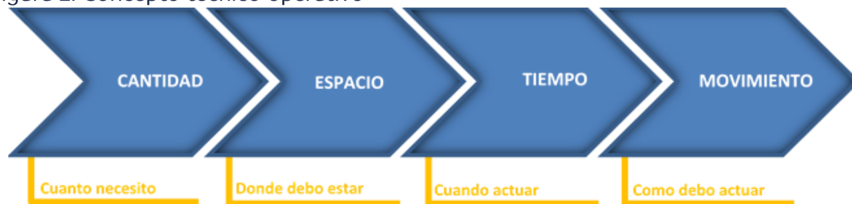
Figura 2: Concepto técnico operativo

d) Movimiento : corresponde a los procesos y procedimientos a implementar para que la actuación, vista ella como una respuesta, se ajuste a las necesidades del caso. El movimiento responde a la pregunta: “¿cómo debo actuar?”.