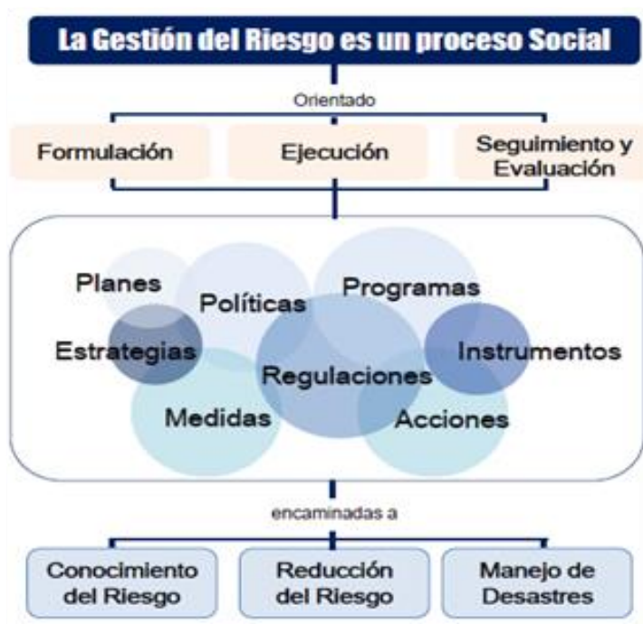
Figura 3: Gestión del riesgo como proceso social

Al ser catalogado como un proceso social, la sociedad en general está involucrada en el conocimiento, la reducción y el manejo de las amenazas.