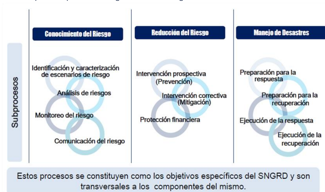
Figura 5: Etapas del proceso de gestión del riesgo

c) Manejo de desastres: corresponde al proceso de respuesta ante cualquier emergencia producto de una amenaza antrópica, técnica o natural. El manejo de desastres debe contemplar todo el arco temporal: antes (identificación, prevención, preparación), durante (respuestas estructuradas) y después del desastre (superación y reconstrucción).