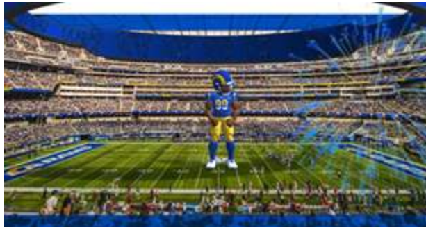
Figura 10. Ejemplo de AR