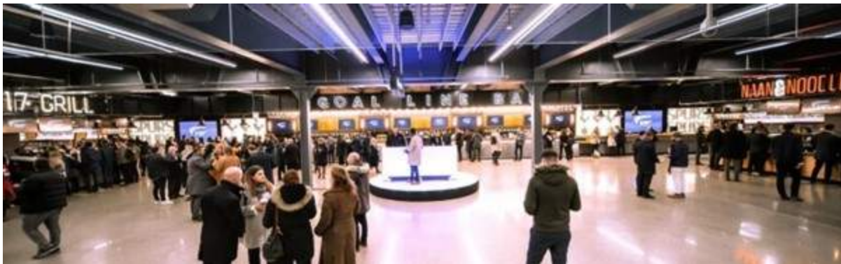
Figura 3. Las facilidades de pago sin efectivo en el nuevo estadio del Tottenham Hotspur