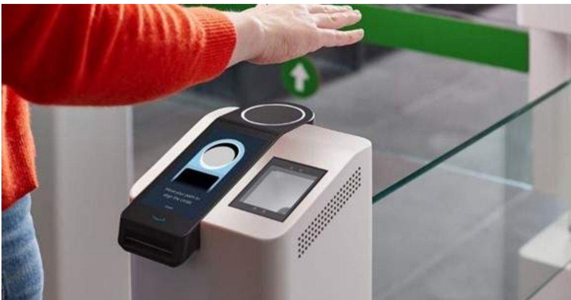
Figura 2. El sistema de acceso de Amazon mediante pago con la palma de la mano

Por otro lado, Amazon está explorando tecnologías innovadoras, como el pago con la palma de la mano, que permitiría a los aficionados simplemente mover la mano para acceder al estadio. La introducción de Amazon One en sus tiendas muestra el potencial de las entradas biométricas para eventos deportivos. Esta tecnología ya se ha probado en el Coors Field de Denver, sede de los Colorado Rockies de las Grandes Ligas de Béisbol, convirtiéndose en el primer estadio en ofrecer la verificación de edad a través de Amazon One (Olwyn, 2023).