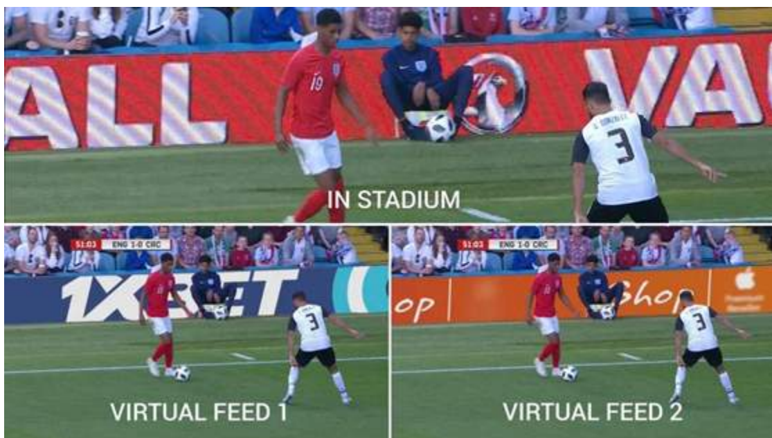
Figura 8. Tecnología de paneles publicitarios de feeds virtuales