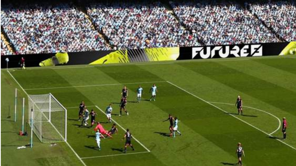
Figura 4. Sistema de pantalla LED perimetral en el estadio del Manchester City