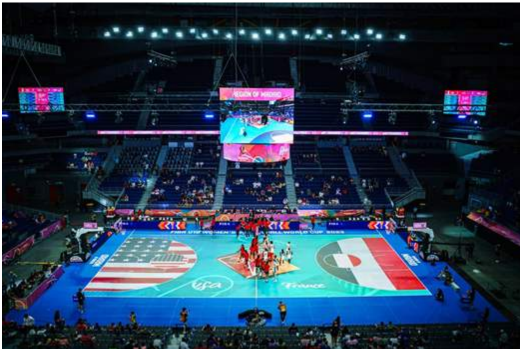
Figura 5. El «suelo de vidrio» de la FIBA