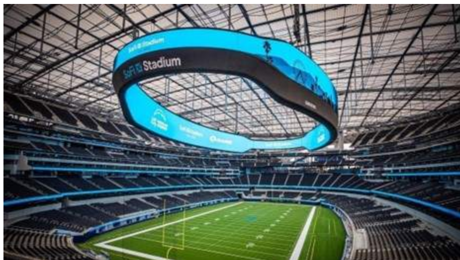
Figura 7. Pantalla Infinity en el SoFi Stadium

Además, Samsung equipó el estadio con más de 2600 pantallas, paneles de cinta (pantallas led largas y delgadas en los balcones) y equipos de audio. Todas estas pantallas utilizan tecnología HDR10+ para brindar una calidad visual superior (Balakumar, 2022).