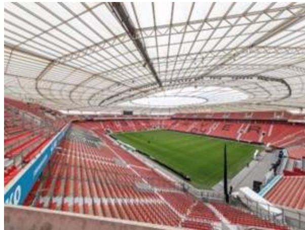
Figura 6. Los nuevos sistemas de audio en BayArena

Por motivos de seguridad, también se instaló un sistema de alarma por voz independiente, conectado a los sistemas de audio profesional del estadio (CODA Audio, 2022).